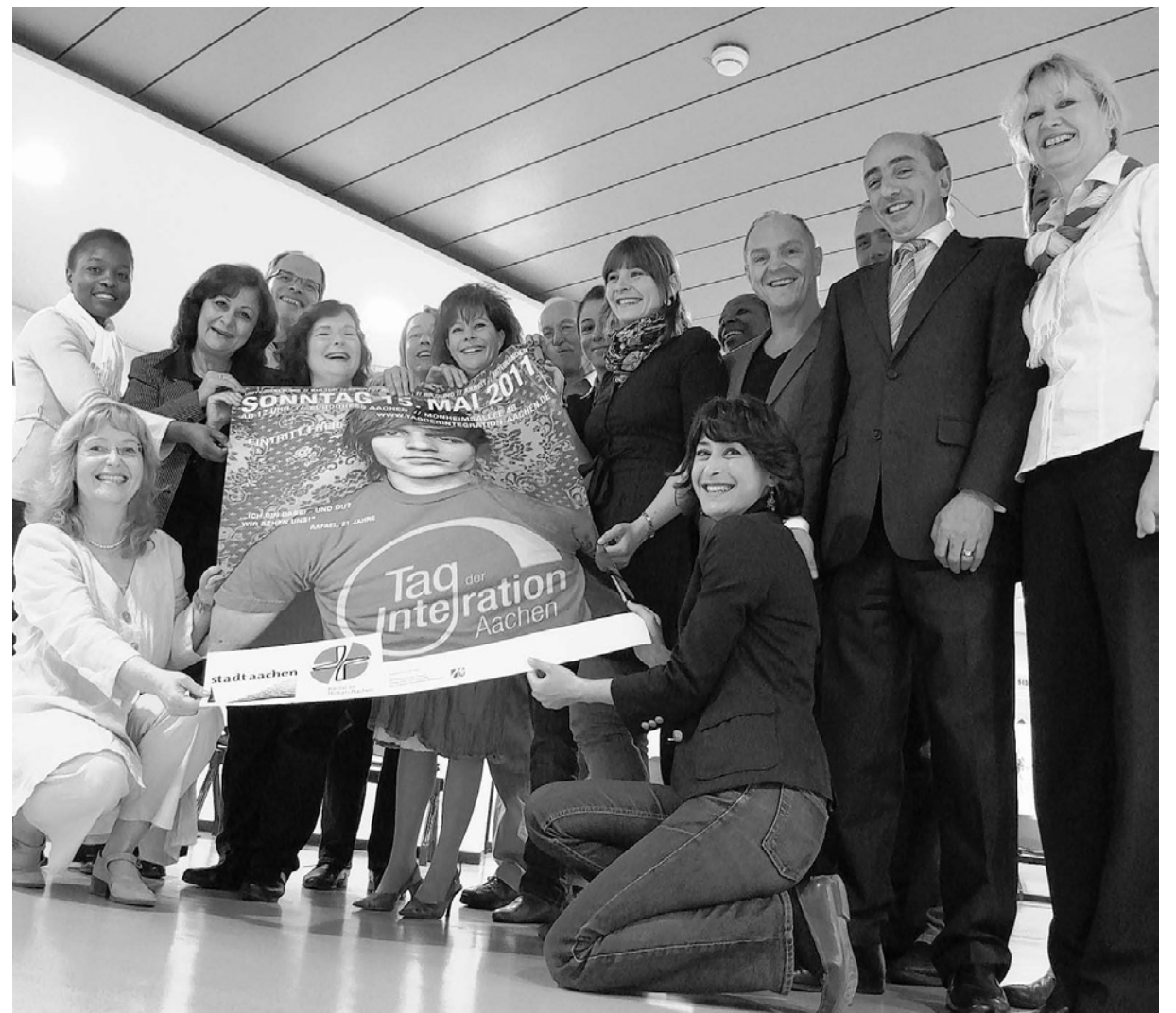
Ein Fest, viele Macher: Die Organisatoren freuen sich auf den 5. Tag der Integration, der am 15. Mai zum ersten Mal im Eurogress gastiert.

Vor fünf Jahren sah die Welt noch anders aus: Der Tag der Integration feierte seine Premiere mit gerade mal fünf Personen im Orga-